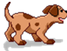
Aboyer= to bark